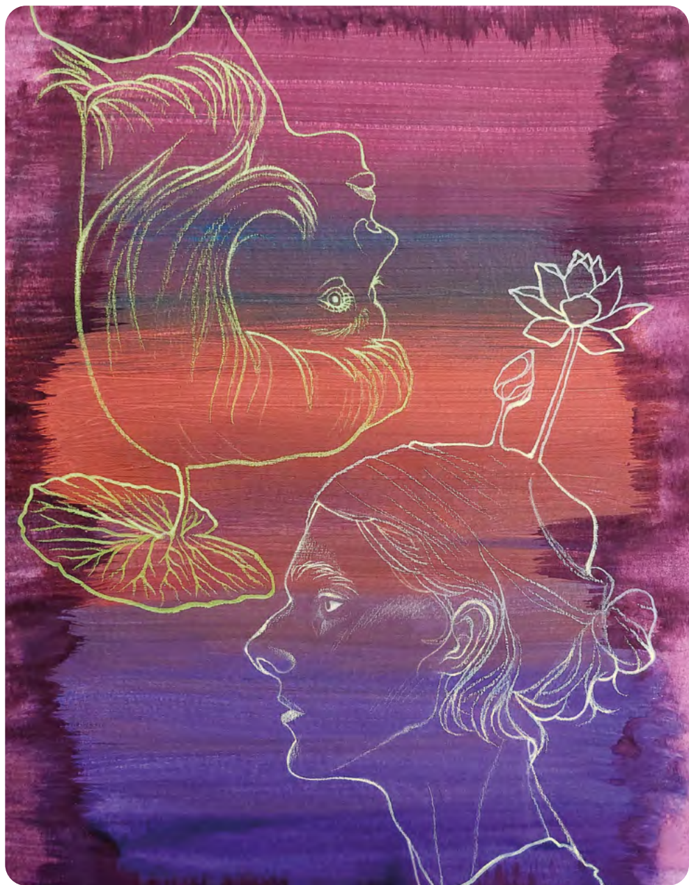
Illustration : ROMANE AUFFRET

Élève de CPES – CAAP au lycée Pablo-Picasso à Fontenay-sous-Bois (94)