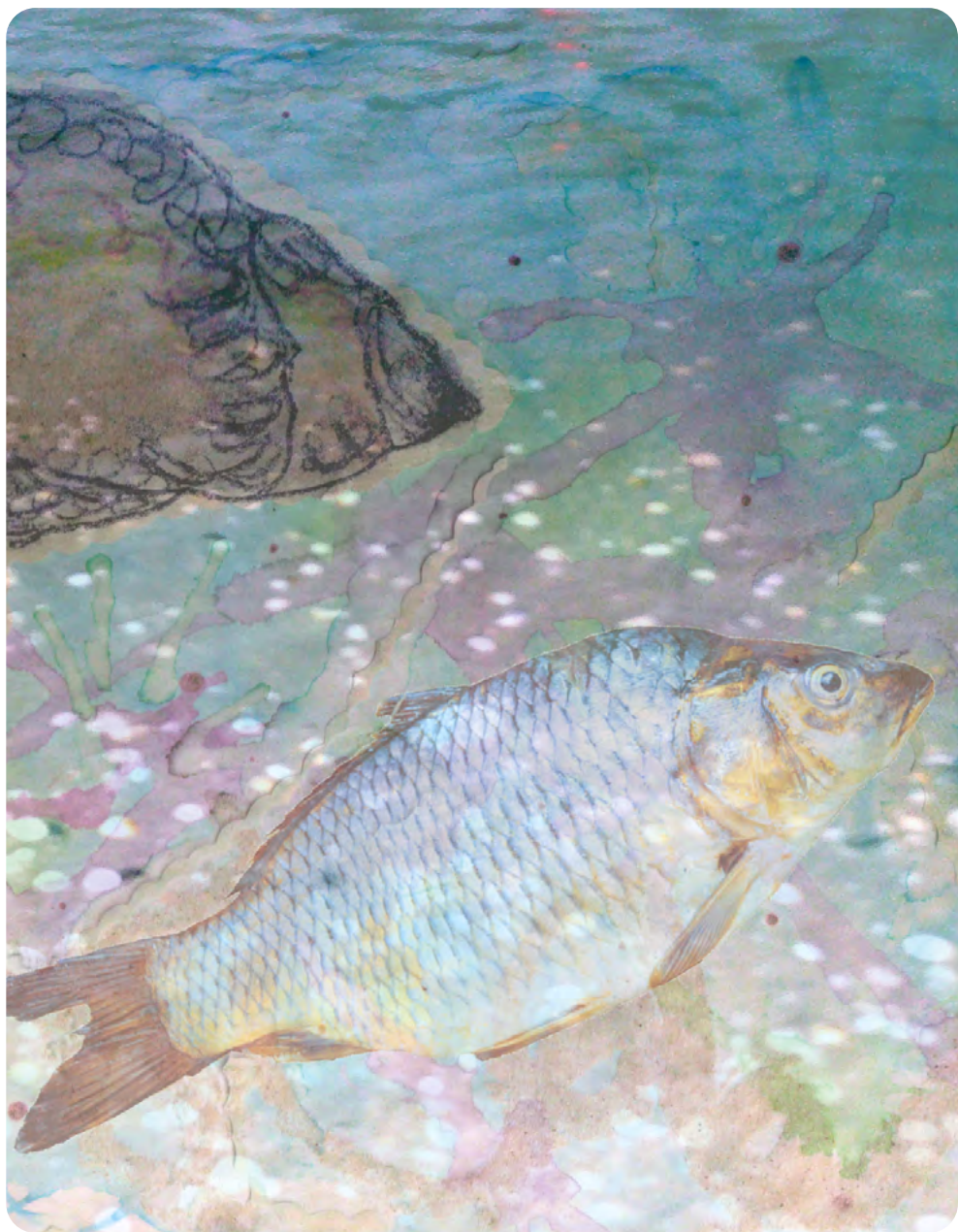
Illustration : OCÉANE BOS

Élève de CPES – CAAP au lycée Pablo-Picasso à Fontenay-sous-Bois (94)