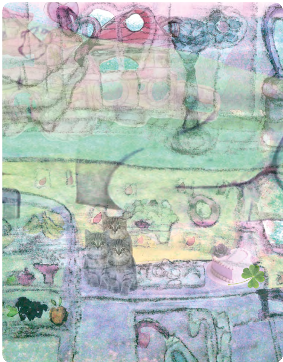
Illustration : OCÉANE BOS

Élève de CPES – CAAP au lycée Pablo-Picasso à Fontenay-sous-Bois (94)