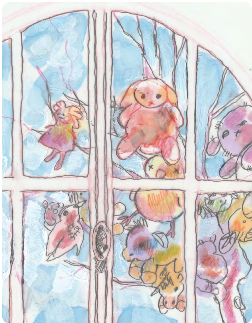
Illustration : CHARLOTTE DELAUME

Élèves écrivains : CLASSE DE 6 e E – COLLÈGE CLAUDE-DEBUSSY À AULNAY-SOUS-BOIS