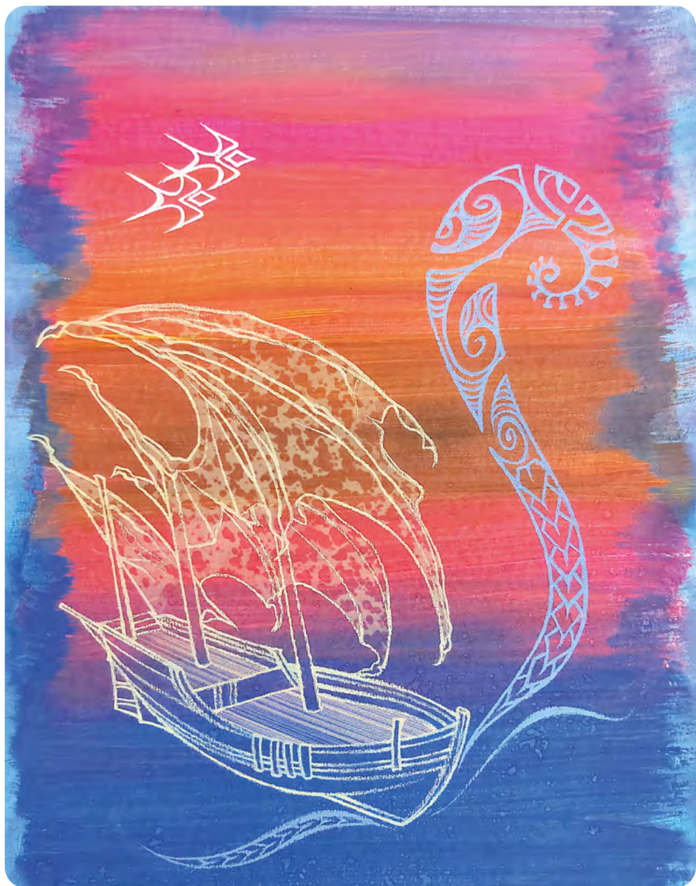
Illustration : ROMANE AUFFRET

Élève de CPES – CAAP au lycée Pablo-Picasso à Fontenay-sous-Bois (94)