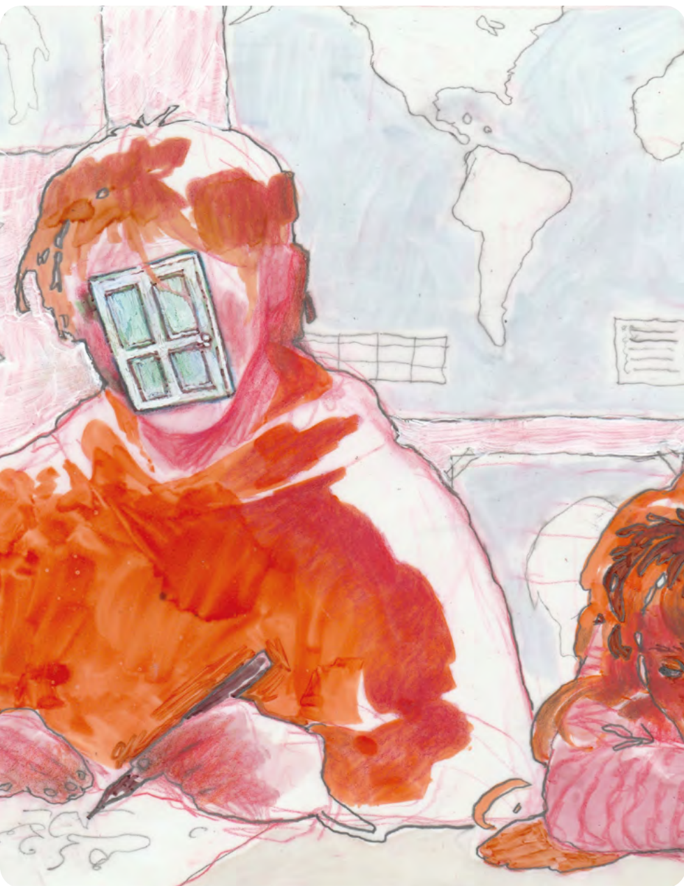
Illustration : CHARLOTTE DELAUME

Élève de CPES – CAAP au lycée Pablo-Picasso à Fontenay-sous-Bois (94)