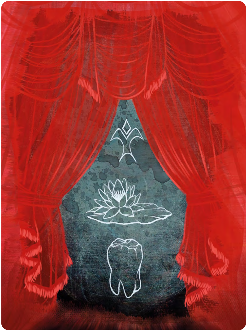
64 | Illustration : ROMANE AUFFRET Élève de CPES – CAAP au lycée Pablo-Picasso à Fontenay-sous-Bois (94)