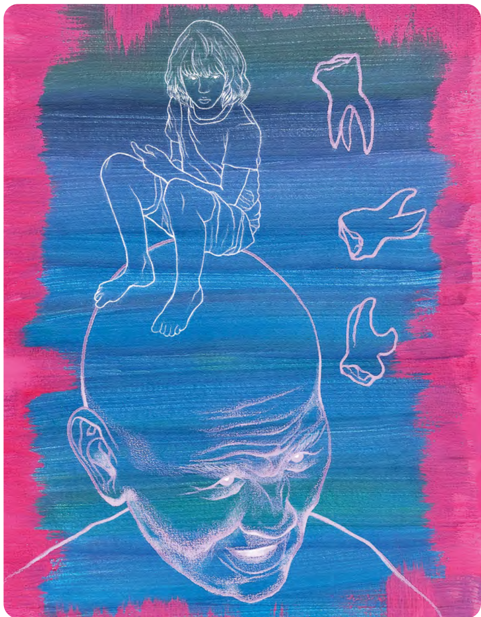
Illustration : ROMANE AUFFRET

Élève de CPES – CAAP au lycée Pablo-Picasso à Fontenay-sous-Bois (94)