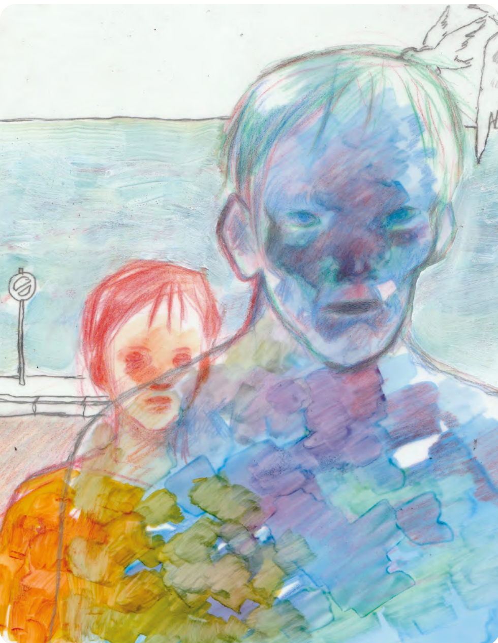
Illustration : CHARLOTTE DELAUME

Élèves écrivains : CLASSE DE 6 e DEF (groupe 2) COLLÈGE LIBERTÉ À DRANCY